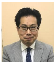
北出経営企画部長